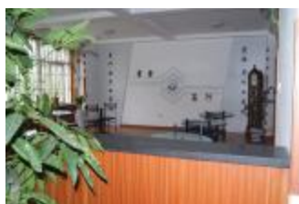
图 2 中心教学楼逸客厅