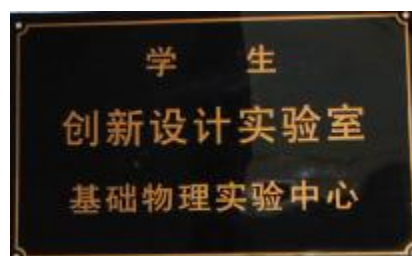
图 7 为培养学生创新意识与动手能力新搭建了“制作室”、“创新室”等实验教学平台