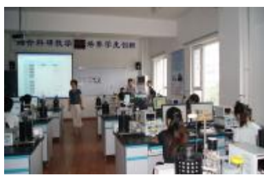
图 5 远程控制室可以实现“仪器在实验室，操作在互联网”