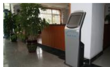
图 3 中心选课系统前哨