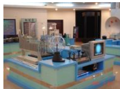
图 6 物理演示大厅位于国家大学生文化素质基地博物馆二楼