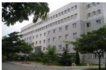
图 1 物理实验中心

大连大学基础物理实验中心拥有实验面积 2464 平方米、59 个实验室，设备 1490 台套件、总值达 1160.7 万元。教学楼（图 1、2、3）面貌焕然一新，为学生营造了良好的实验环境，改善了教师的教学环境。实验设备逐年更新（图 4），新建了远程控制室（图 5），完善了物理演示大厅（图 6），还为本科生发明创造、动手实做，培养创新意识、顿悟成功信心搭建了新的科教互动平台（图 7）。基础物理实验中心将继续保持与时俱进的发展理念，进一步改善实验设备与实验教学环境，力争建设成地方一流的基础物理实验教学基地。