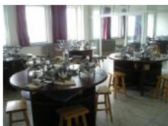
图 4 普通物理实验室